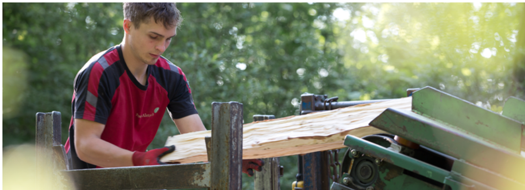
Brennholz bereitstellen ist mit viel Handarbeit verbunden – trotzdem bleiben 2022 unsere Preise stabil.